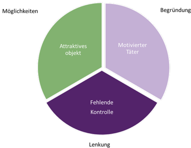
Abbildung 2. Elemente, die für die Anfälligkeit für Betrug maßgeblich sind

Der Zusammenhang zwischen Möglichkeiten, Motivationen, Lenkungsmaßnahmen und der Anfälligkeit für Futtermittelbetrug wird in der folgenden Abbildung 3 dargestellt.